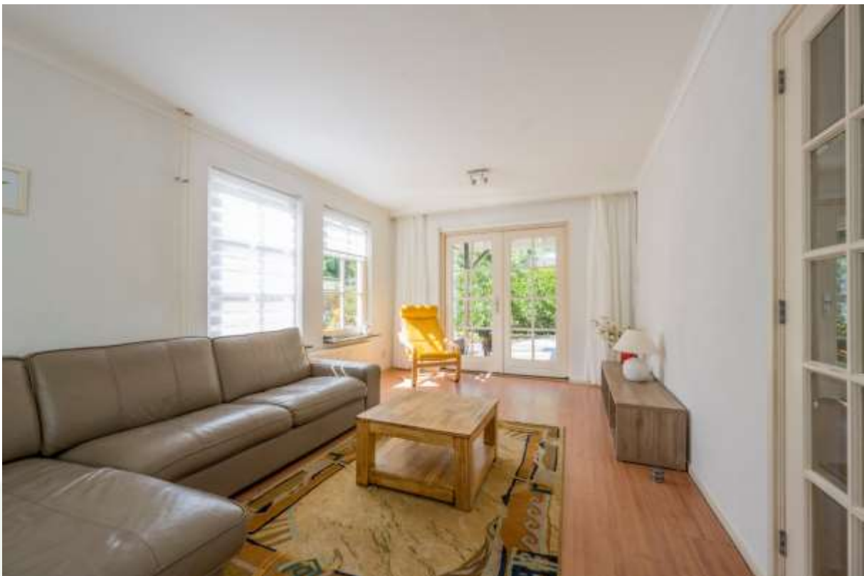
Woonkamer met openslaande deuren naar de veranda