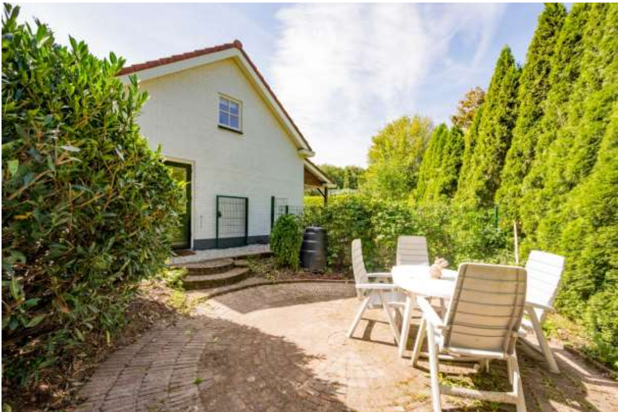
Terras vanuit de keuken bereikbaar