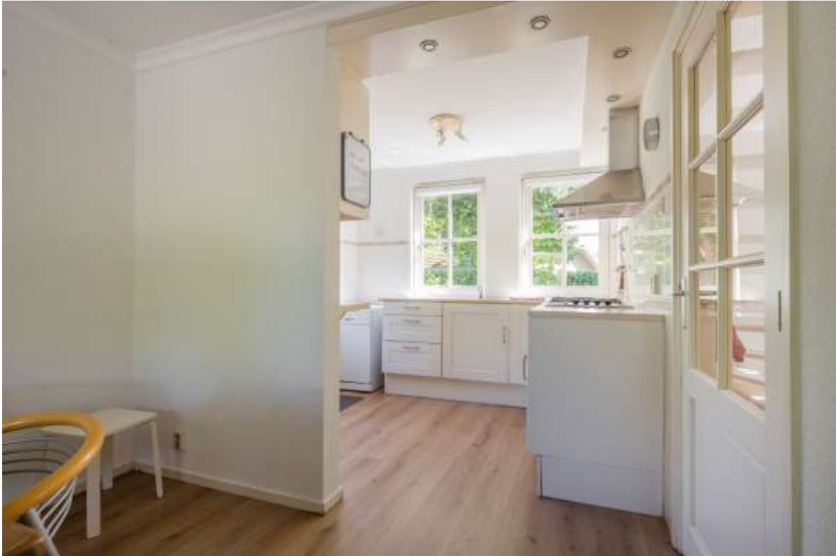
Half open keuken