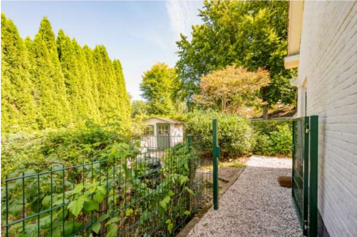
Tuin met tuinhuis