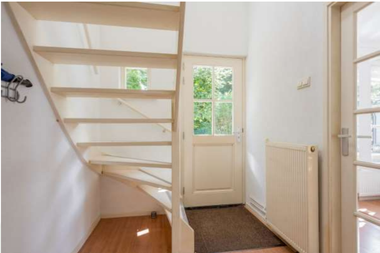
Hal met trapopgang